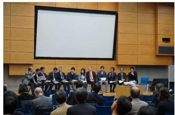
写真2 パネルディスカッションの様子