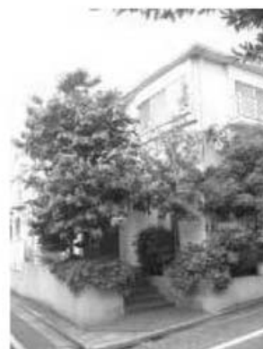
高木と低木が重なるように植栽した例

なお、植栽樹種・草本種を選択する場合は、地域の生態環境を保全し、地域の自然環境のもとに育まれてきた固有の地域景観を継承する観点から、できるだけ郷土種や自生種を採用することが望ましい(CASBEE-戸建(新築)評価マニュアルの「LR H 3.2.2 既存の自然環境の保全」の項を参照)。