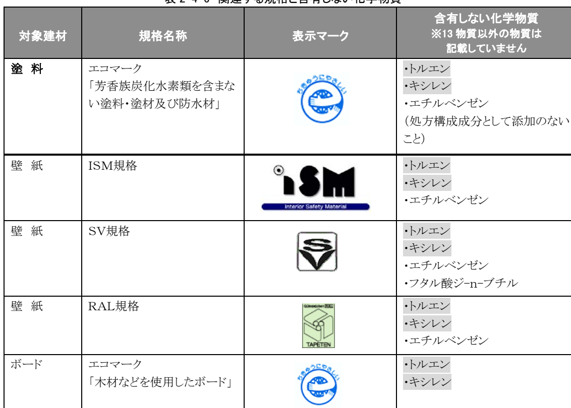
表 2-4-6 関連する規格と含有しない化学物質

※表中の13物質とは、厚生労働省が室内濃度指針値を定めたもの(表5-4-9)をさします。