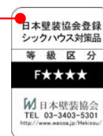
表 2-4-5 ホルムアルデヒド発散区分に関する表示ガイドライン