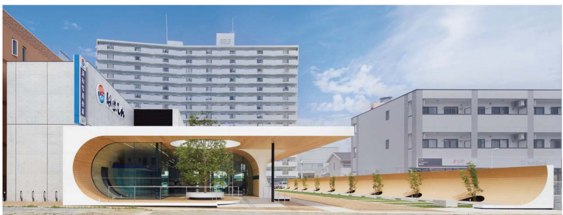
第6回 国土交通大臣賞 (小規模建築部門) 浜松信用金庫 駅南支店