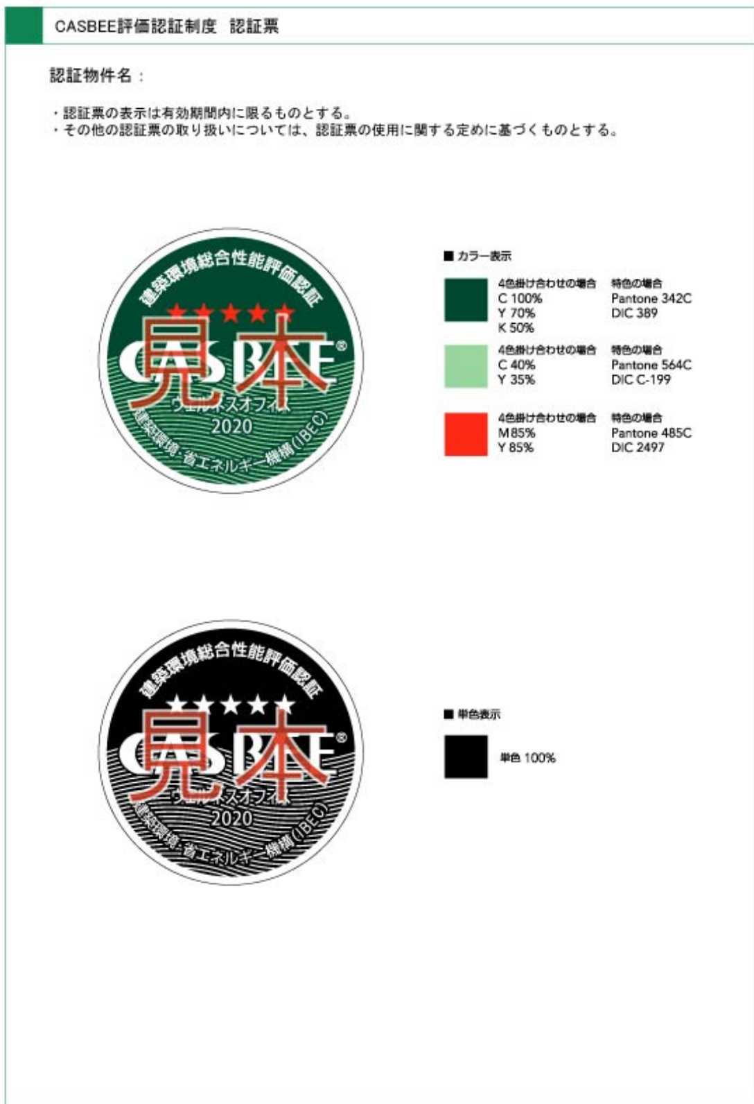
(様式 4-1) CASBEE ウェルネスオフィス評価認証票