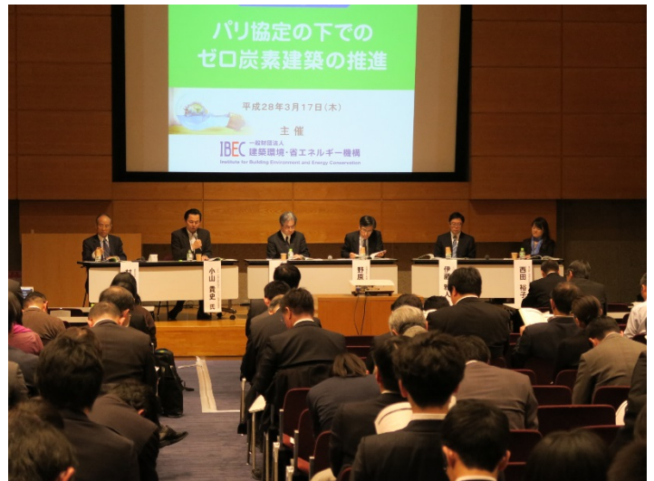
写真2 パネルディスカッションの様子