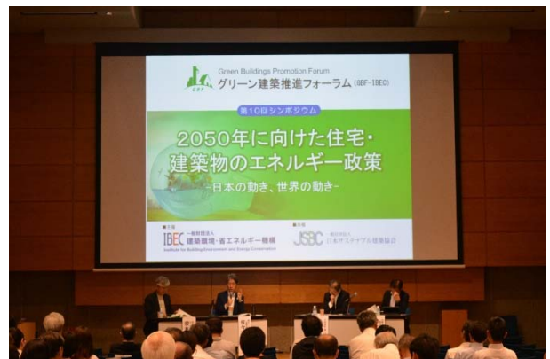
写真2 パネルディスカッションの様子